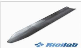
Espátula Tipo Canaleta em Aço Inox + 12cm